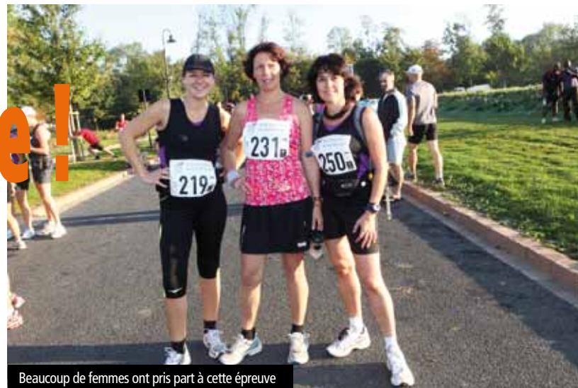
Beaucoup de femmes ont pris part à cette épreuve