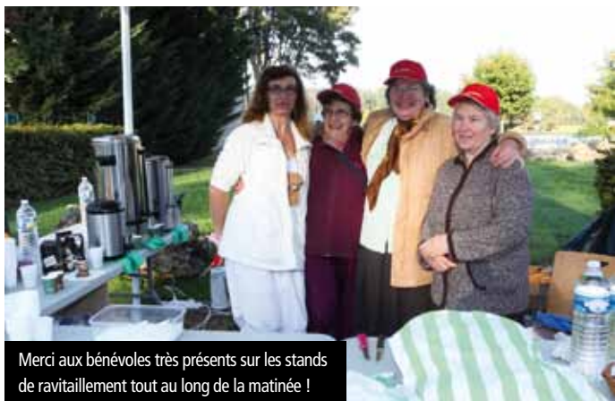
Merci aux bénévoles très présents sur les stands de ravitaillement tout au long de la matinée !