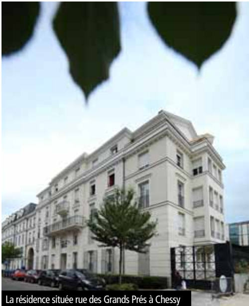
La résidence située rue des Grands Prés à Chessy

Les résidences « Résidétape » accueillent des publics ayant un lien à l'emploi et rencontrant des difficultés temporaires de logement (jeunes salariés, salariés en mobilité). Ce sont des « logement-étape » leur permettant de consolider leur situation personnelle ou professionnelle avant d'intégrer un logement autonome et de construire un projet résidentiel à plus long terme.