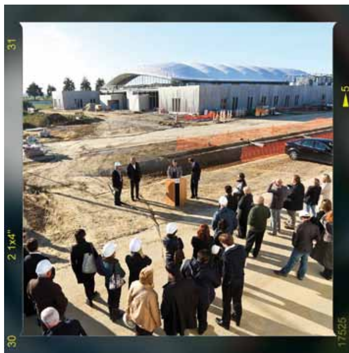
Centre aquatique du Val d'Europe : une visite de chantier du futur centre aquatique du Val d'Europe a eu lieu le samedi 15 octobre dernier en présence des élus du Val d'Europe et de l'architecte. L'ouverture du centre aquatique du Val d'Europe est prévue pour le premier semestre 2012. Nous y reviendrons dans une prochaine édition.