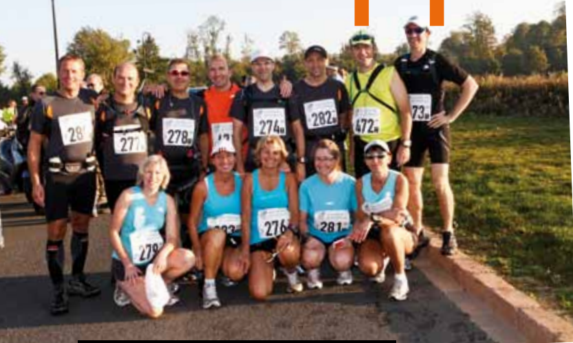
Course en équipe pour se serrer les coudes et s'encourager