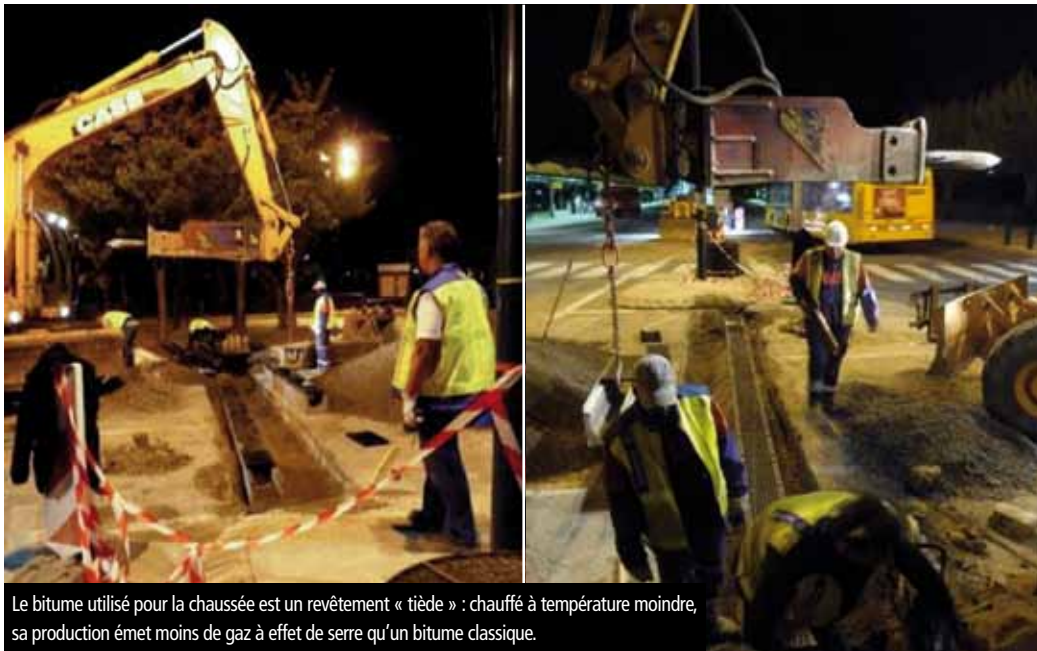
Le bitume utilisé pour la chaussée est un revêtement « tiède » : chauffé à température moindre, sa production émet moins de gaz à effet de serre qu'un bitume classique.