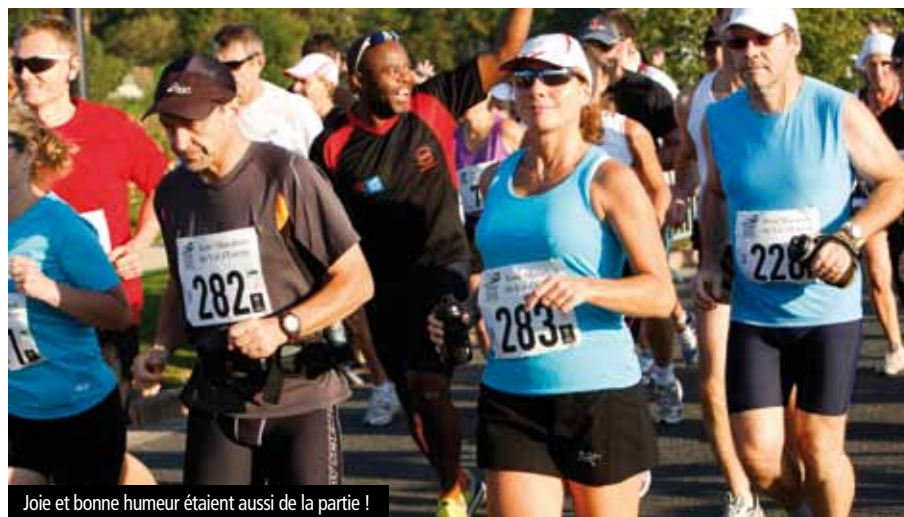
Joie et bonne humeur étaient aussi de la partie !