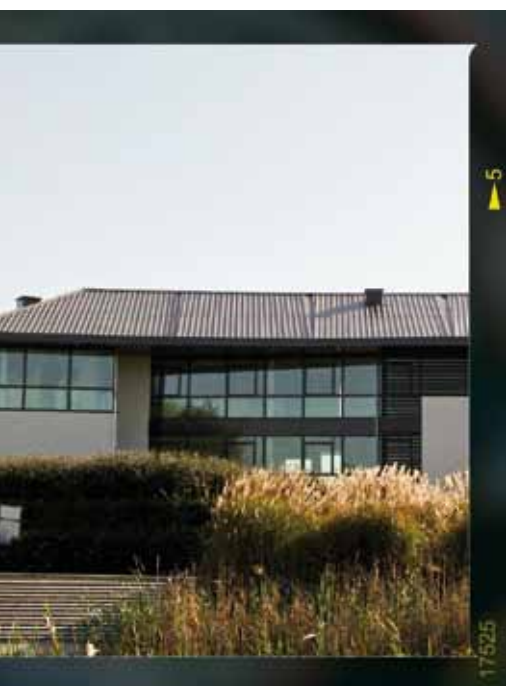
Spectaculaire ! Le bâtiment de la Chambre de commerce et d'industrie de Seine-et-Marne s'est élevé en moins d'une année dans le Val d'Europe Park. L'entrée des salariés dans leur nouveau siège est prévue début 2012.