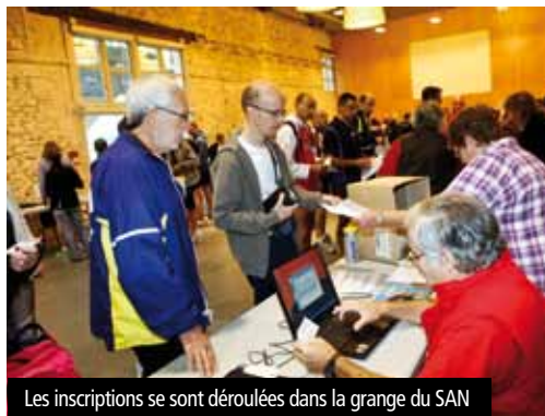
Les inscriptions se sont déroulées dans la grange du SAN