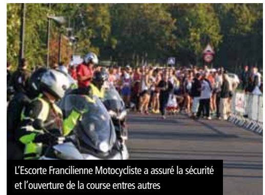
L'Escorte Francilienne Motocycliste a assuré la sécurité et l'ouverture de la course entres autres