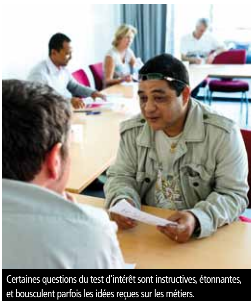
Certaines questions du test d'intérêt sont instructives, étonnantes, et bousculent parfois les idées reçues sur les métiers.