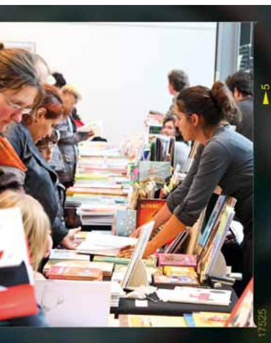
Le salon des petits éditeurs jeunesse a rassemblé plus de 600 amateurs de tous âges, samedi 8 octobre , à la médiathèque du Val d'Europe.

L'Etablissement public d'aménagement (EPA France) a largement communiqué sur l'adoption des dossiers de création de Zone d'aménagement concertée (ZAC). Pour passer de la communication à l'information, sur des sujets aussi techniques que les procédures du droit de l'aménagement, il est parfois bon de revenir aux fondamentaux.