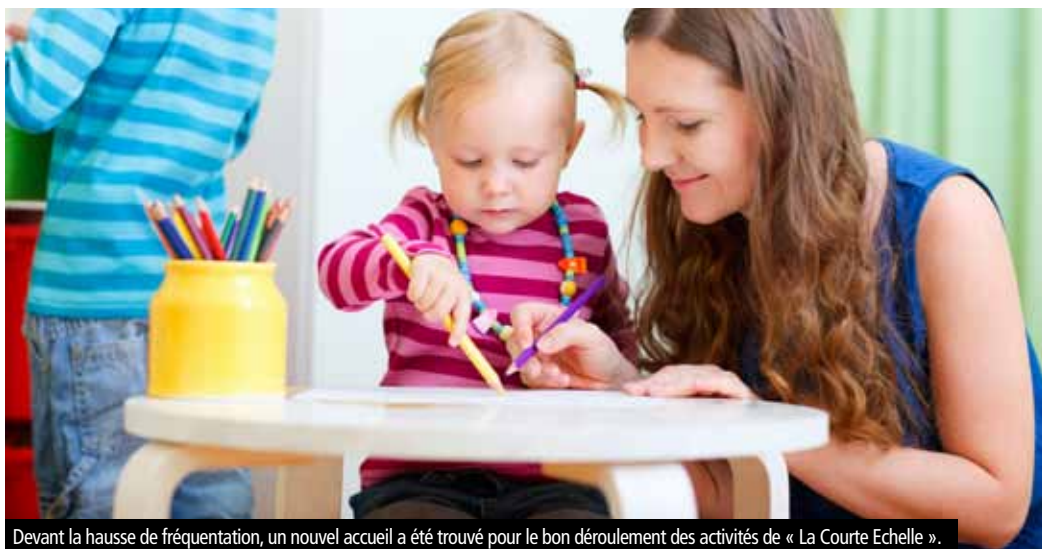
Devant la hausse de fréquentation, un nouvel accueil a été trouvé pour le bon déroulement des activités de « La Courte Echelle ».

Association exerçant dans le domaine de la petite enfance, celle-ci arrive aujourd'hui à saturation au niveau de la fréquentation de son accueil qui est implanté au Centre Social Intercommunal (CSI) du Val d'Europe. Afin de préserver la qualité de l'accueil, il devenait urgent d'en proposer un nouveau, cette fois-ci sur Magny le Hongre, commune où la demande était très importante.