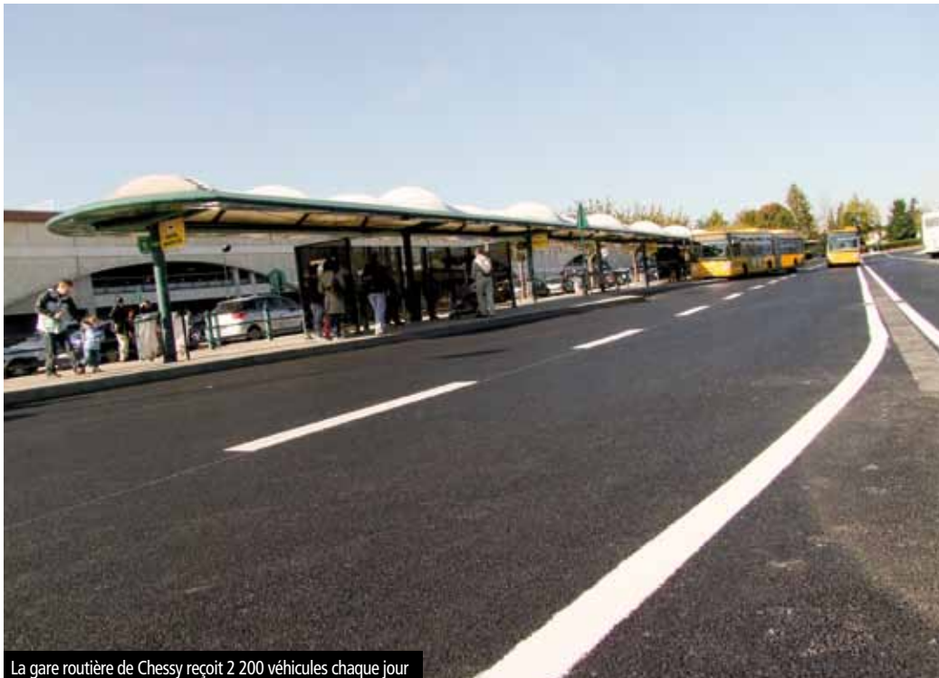
La gare routière de Chessy reçoit 2 200 véhicules chaque jour

Pour ses vingt années d'existence, la gare routière de Chessy s'est offert un indispensable lifting de sa voirie. Mise aux normes des quais pour l'accès aux personnes à mobilité réduite, réfection des évacuations d'eaux pluviales, de la chaussée puis de la signalétique, ont demandé des nuits de travail aux équipes mandatées par le SAN du Val d'Europe cet automne. Coût de l'opération : 575 800 € TTC.