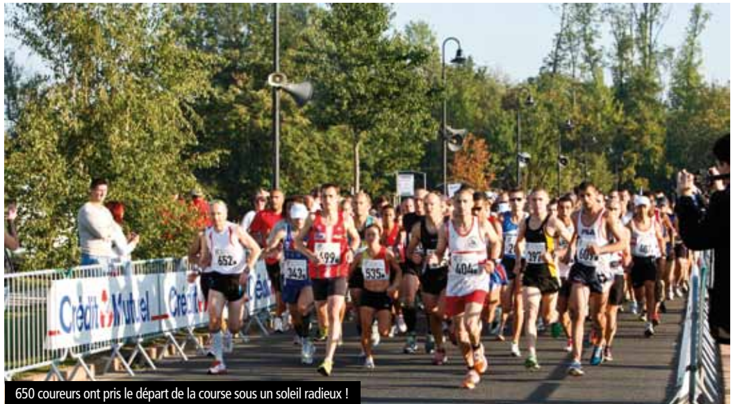
650 coureurs ont pris le départ de la course sous un soleil radieux !

Retrouvez la vidéo sur : www.valdeurope.tv