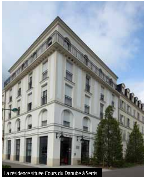
La résidence située Cours du Danube à Serris

Quant à leur situation professionnelle, 100 % des résidents étaient en activité dont 79 % en CDI au 31 décembre 2010. En général, leur vie professionnelle débute par un CDD qui va ensuite se transformer en CDI, ce qui revient à conclure que la Résidétape accueille des personnes à forte proportion d'emplois stables. On constate cependant qu'il y a une augmentation des faibles revenus et des revenus plus élevés : le revenu mensuel moyen est passé de 1 155 € en 2009 à 1 096 € en 2010. Quant aux revenus les plus élevés, 33 % des résidents gagnent plus de 1 200 € par mois en 2010 contre 26 % en 2009. Enfin au niveau de la durée de séjour, 50 %