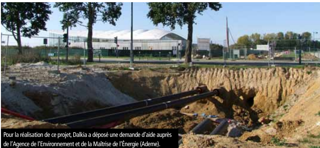
Pour la réalisation de ce projet, Dalkia a déposé une demande d'aide auprès de l'Agence de l'Environnement et de la Maîtrise de l'Énergie (Ademe).

Dalkia, service commercial : 01 46 62 55 86 ou reseaupvde@dalkia.com