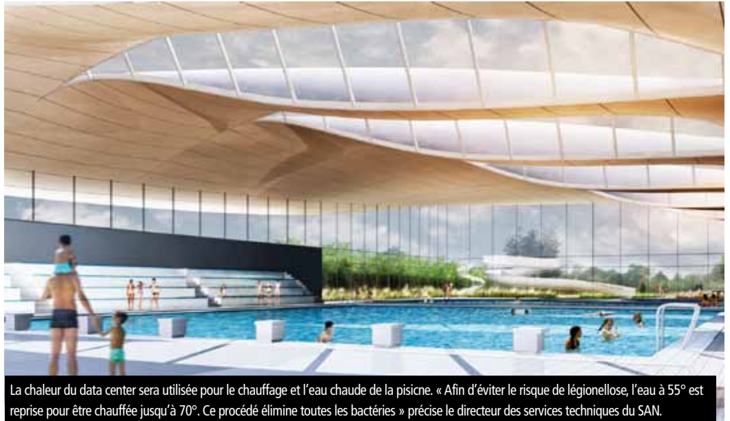
La chaleur du data center sera utilisée pour le chauffage et l'eau chaude de la piscine. « Afin d'éviter le risque de légionellose, l'eau à 55° est reprise pour être chauffée jusqu'à 70°. Ce procédé élimine toutes les bactéries » précise le directeur des services techniques du SAN.

C'est un réseau de distribution constitué d'une double canalisation qui chemine sous les chaussées du parc d'entreprises. Il comprend un « circuit aller » qui transporte l'eau à 55°C vers les stations des abonnés, et un circuit retour qui retourne l'eau à 37°C environ à la chaufferie. C'est donc un circuit fermé. Une chaudière à gaz de secours assure la continuité du chauffage de l'eau en cas de panne.