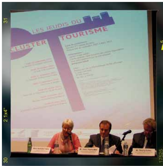
La 1 re conférence des jeudis du Cluster Tourisme s'est tenue le jeudi 22 septembre dernier à l'auditorium de la médiathèque du Val d'Europe, avec pour thème : « le marché touristique francilien ». Un joli succès pour les organisateurs puisque la conférence a fait salle comble !