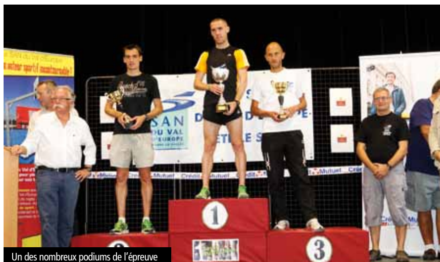
Un des nombreux podiums de l'épreuve