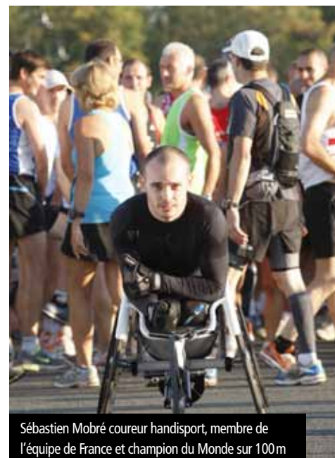
Sébastien Mabré coureur handisport, membre de l'équipe de France et champion du Monde sur 100m